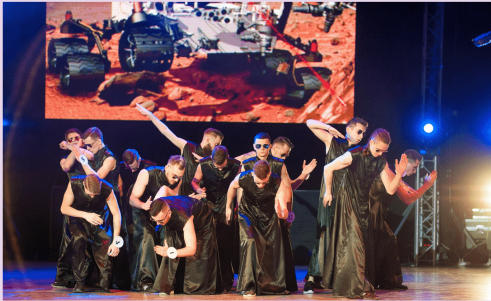
Мистер Иваново (с. 3)