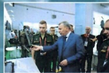
Участие в конгрессно-выставочной деятельности