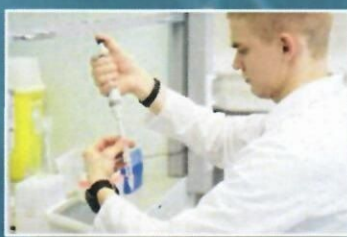
Проведение научных исследований