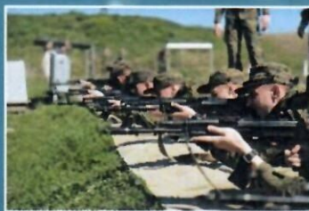
Курс начальной боевой подготовки

Наличие высшего профильного образования со средним баллом не ниже 4,5