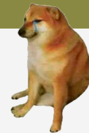
самопрезентация без средств выразительности