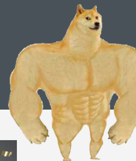
самопрезентация с использованием средств выразительности

Таким образом, студентами были использованы самые разнообразные тропы и фигуры речи, что позволяло сделать акцент на тех или иных аспектах их самопрезентаций. Исследование может продолжаться в аспекте разработки методики обучения студентов самопрезентации с использованием средств словесной образности.