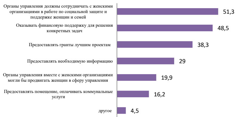
Рис. 3. Меры поддержки женских организаций государством в оценках респонденток, в % (n=1087)

каждая пятая из опрошенных женщин, среди них 27 – 28% составляют женщины среднего возраста, респондентки с высшим образованием и женщины, занимающие руководящие посты / предпринимательницы.