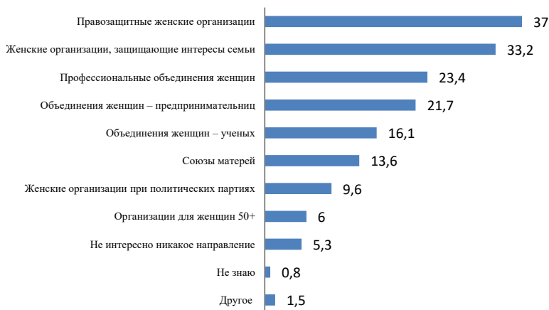
Рис. 2. Профили деятельности женских организаций, в работе которых готовы участвовать респондентки, в %, n=510 чел.

ответственно), а также объединения женщин-ученых (16,1%). Полученные данные свидетельствует о возможном формировании практик взаимодействия женского активизма с его институционализированной формой – женскими организациями.