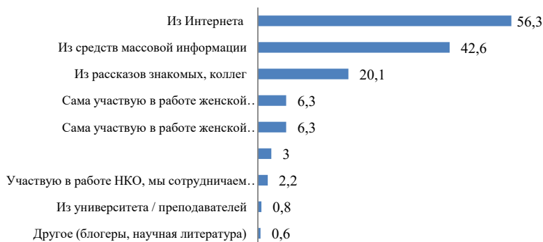
Рис. 1. Источники получения информации о работе женских организаций, в % n=1087 чел.

Большинство респонденток (80,3%) отметили, что знают, либо слышали о работе женских организаций, действующих на территории России. Наибольшая осведомленность отмечена среди опрошенных с высшим образованием (93%), а также среди женщин в возрасте до 35 лет (96%). Основными источниками информации о деятельности женских организаций опрошенные выступают Интернет-ресурсы (56,3%), СМИ (42,6%) и рассказы знакомых (20,1%).