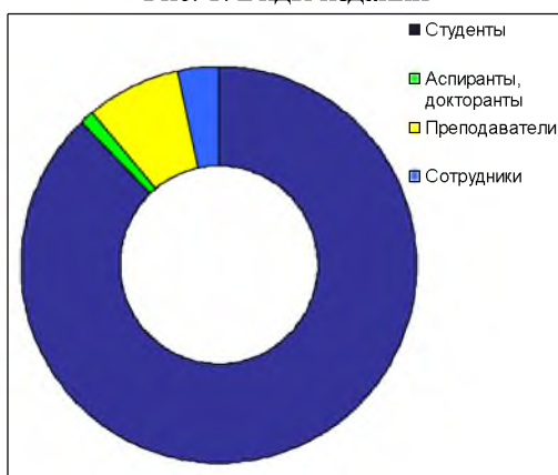
Рис. 3. Контингент пользователей