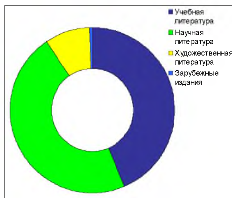
Рис. 2. Состав фонда библиотеки ИвГУ