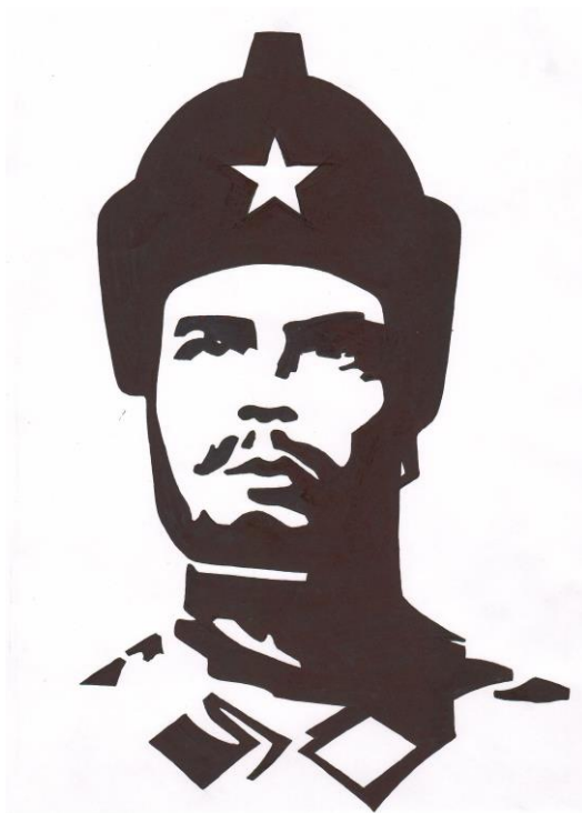
Шипина О.К. Командарм Фрунзе. Графика. 2020 год