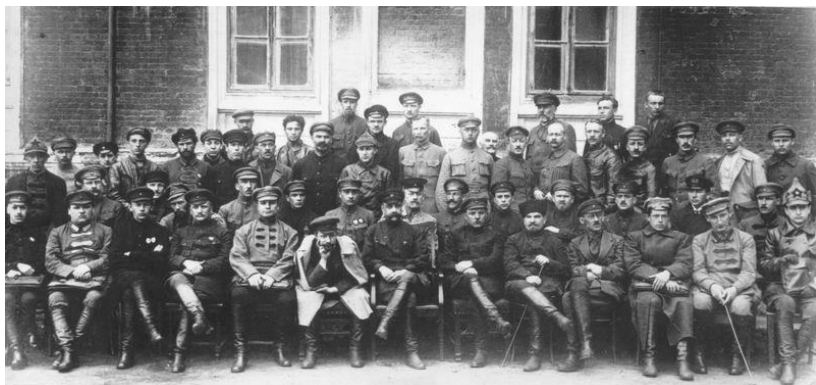
М. В. Фрунзе среди начкомсостава. 1925 год