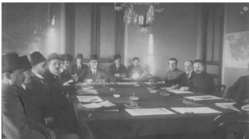
М. В. Фрунзе на переговорах в Турции, 1922 год