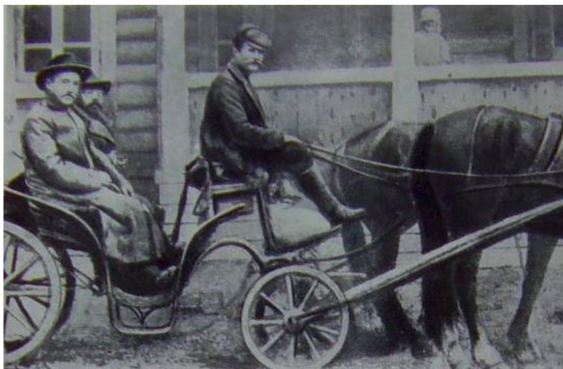
М. В. Фрунзе среди ссылных, 1915 год