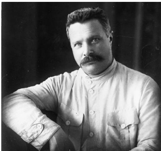
М. В. Фрунзе, 1920-е годы