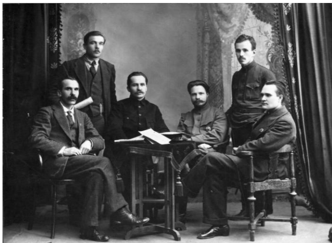
М. В. Фрунзе среди членов губсовнаркома. 1918 год