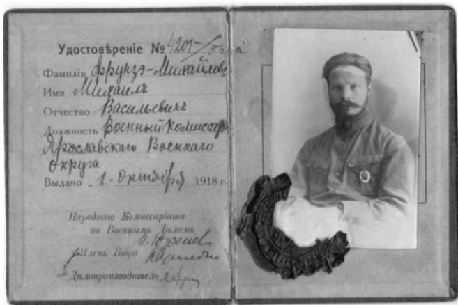
Удостоверение М. В. Фрунзе – комиссара Ярославского военного округа. 1918 год