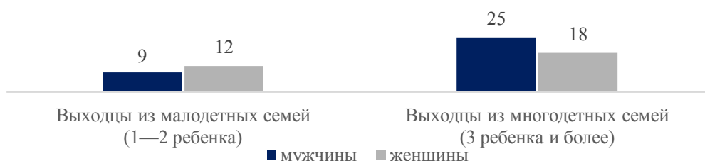
Рис. 2. Доля многодетных среди мужчин и женщин в зависимости от числа детей в родительских семьях (по данным СеДОЖ-2019), %

Результаты исследования показали, что вероятность стать многодетными родителями у выходцев из многодетных семей выше, чем у тех, кто вырос в семьях с одним или двумя детьми. Так, среди мужчин, которые были воспитаны в малодетных родительских семьях, лишь 9 % стали многодетными отцами, а среди тех, чьи родители были многодетными, — 25 %, т. е. почти в три раза больше. Статистическая значимость наблюдаемых отличий подтверждается анализом критерия Хи-квадрат ( \chi^2(1) = 55,29 , p < 0,001 ). Различие между двумя группами составляет 16 п. п., а его статистическая значимость бесспорна ( p < 0,001 ). Среди женщин, детство которых прошло в малодетных семьях, многодетными матерями стали 12 %, а среди женщин, выросших в многодетных семьях, — 18 % ( \chi^2(1) = 6,896 , p = 0,009 ). Различие также значимо (z-тест, p = 0,01 ), но составляет лишь 6 п. п., что почти в три раза меньше соответствующего различия у мужчин. Удивление вызывает то, что эта вполне естественная закономерность среди мужчин проявилась сильнее, чем среди женщин (рис. 2).