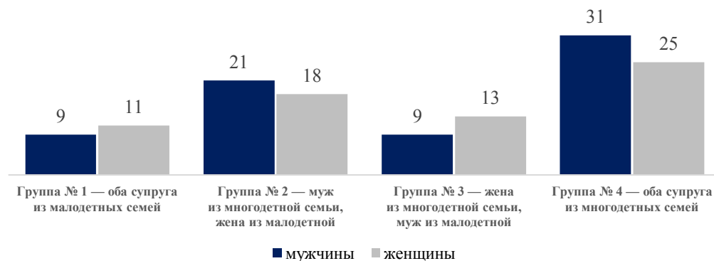
Рис. 3. Доля многодетных среди мужчин и женщин в зависимости от числа детей в родительских семьях (по данным СеДОЖ-2019), %

Для ответа на этот вопрос надо обратить внимание на долю многодетных среди женщин (рис. 3). В группе № 1, т. е. среди женщин, которые выросли в малолетних семьях и состоят в браке с мужчинами из таких же семей, только 11 % являются многодетными матерями. В противоположной группе № 4, в которой оба супруга происходят из многодетных семей, доля многодетных матерей составляет 25 %. Разница между этими крайними группами женщин довольно значительна (14 п. п.), но все же меньше различия между соответствующими группами мужчин (22 п. п.).