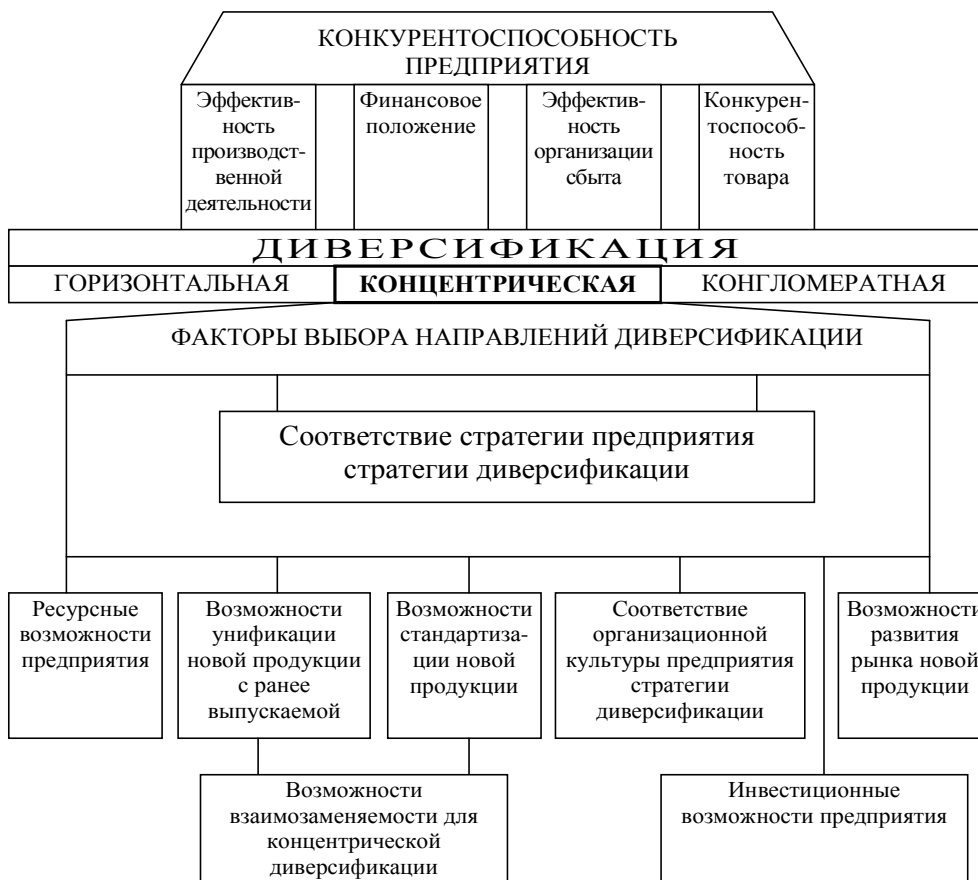
Рис. 1. Факторы выбора направлений концентрической диверсификации

Для анализа возможностей предприятия при выборе вида диверсификации предлагается группа факторов, представленная на рис. 1.