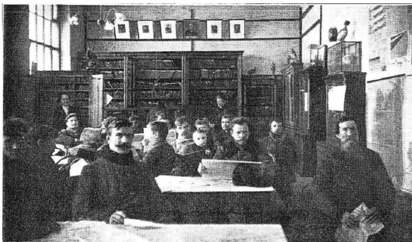
Ил. 5. Библиотека-читальня при Народном доме Красильщиковых в Родниках (начало XX в.)

В 1903 г. при Народном доме Красильщиковы создали замечательную народную библиотеку. Она обслуживала читателей с 9.00 до 18.30 часов ежедневно, кроме праздничных и воскресных дней. По праздникам и воскресеньям рабочие имели возможность почитать свежие газеты в чайной Народного дома, вмещавшей до 400 человек. В библиотеке был оборудован уютный читальный зал, в котором практиковалось коллективное чтение новых периодических изданий (ил. 5). Кстати, Красильщиковы выписывали в читальню более 20 газет и журналов. Расход на содержание и пополнение библиотеки ежегодно составлял около 1 тыс. рублей. Если в 1904 г. в ее фонде насчитывалось 2,7 тыс. томов, то в 1913 г. — уже более 5 тыс. томов. Лучше других был укомплектован отдел беллетристики, в котором в 1913 г. находилось более 2 тыс. книг. Он же являлся лидером по популярности среди читателей. В 1912 г. из него выдавалось на дом более 18 тыс. книг. Посещаемость библиотеки при Народном доме увеличивалась с каждым годом. Если в 1904 г. ее посетили чуть более 11 тыс. раз, то в 1912 — уже свыше 21 тыс. раз. При этом неуклонно возрастало число взятых книг и периодических изданий. Так, в 1904 г. читателями было взято около 15,5 тыс. томов, а в 1912 г. — 28,5 тыс. томов [13, с. 17].