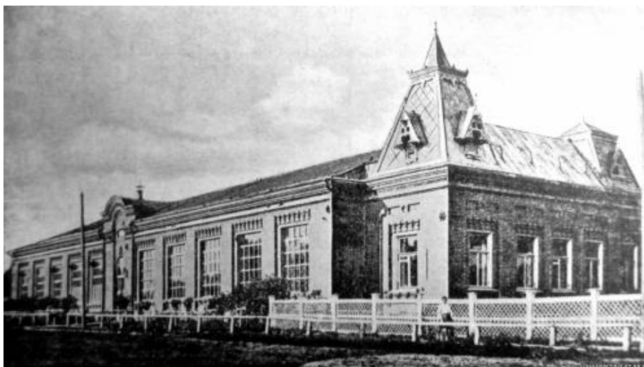
Ил. 4. Народный дом Красильщиконых в Родниках (начало XX в.)

С удовлетворением заметим, что и после смерти Анны Михайловны фабриканты Красильщиконы не отказались от просвещения своих рабочих. В 1903 г. в Родниках на их средства был построен Народный дом, который стал главным культурно-просветительным центром для всего окрестного населения (ил. 4). На его возведение Красильщиконы выделили 50 тыс. рублей. Народом назвали в честь костромского губернатора И. М. Леонтьева [13, с. 20—21].