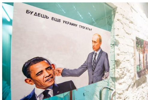
Ил. 4 [1]

Итак, российские медиа используют репрезентации мужественности Путина и Обамы с целью легитимации власти и обоснования права России на независимую внешнюю политику. Материалы нашего интервью помогают понять, насколько такие оценки популярны в общественном мнении. Мы попросили информантов сравнить мужественность Путина и Обамы. Результаты почти не отличались от данных, которые мы получали ранее, в 2007 и 2010 гг., а также от данных всероссийских опросов (обзор опросов см.: [16]). Практически все информанты отдали предпочтение Путину.