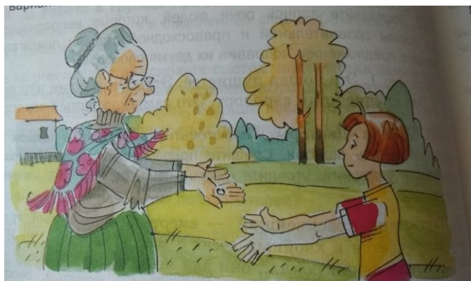
Рис. 4. Иллюстрация из учебника русского языка 6 класса [Шмелев, Флоренская, Пешков, Шмелева, 2014]

культура (13 %), армия, полиция (6 %), сельское хозяйство (6 %). Мужчины в 6 % случаев проявляются в сфере управления, у женщин таких случаев не обнаружено. Женщины задействованы в сферах науки и культуры (45 %), здравоохранения (22 %), спорта (11 %), промышленности (11 %), сельского хозяйства (11 %).