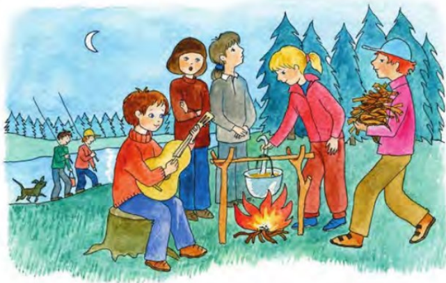
Рис. 3. Иллюстрация из учебника русского языка 6 класса [Быстрова, Кибирева и др., 2017]

В учебниках по гуманитарным предметам к женским семейным ролям обращаются гораздо чаще, чем к мужским, точнее, в 78,6 % случаев. Практически все из них выявлены в материалах по русскому языку. Таким образом, через учебники в сознании детей за женщиной в большей степени закрепляются семейная сфера, дом (рис. 3).