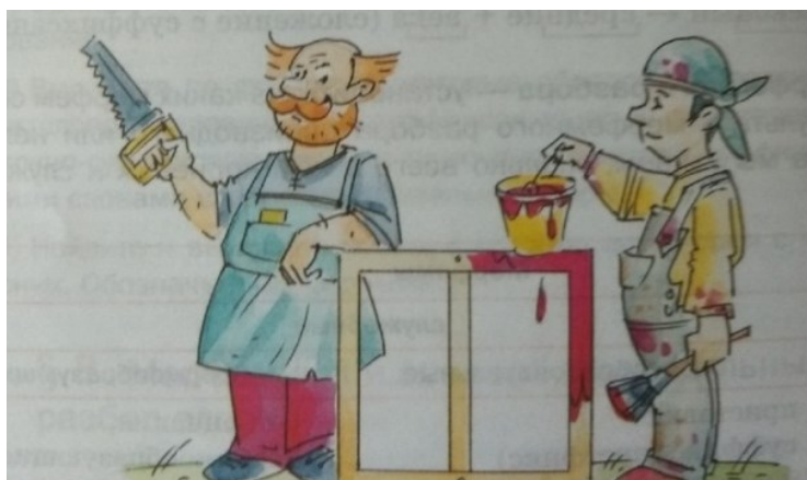
Рис. 2. Иллюстрация из учебника русского языка 6 класса [Шмелев, Флоренская, Пешков, Шмелева, 2014]

В учебниках по гуманитарным предметам обращения к мужским образам составляют 62,3 % от всех гендерно-окрашенных упражнений, а к женским — 37,7 %. Частота обращений к мужским профессиям в учебниках гуманитарного цикла в среднем в 2,5 раза превышает упоминание женских. Причем спектр «мужских» профессий намного богаче. В учебниках по гуманитарным предметам основной сферой занятости мужчин является спорт (22 %), затем армия, полиция и военно-промышленный комплекс (по 12 %), далее следуют IT-сфера и сельское хозяйство (по 8 %), представлены сферы торговли, образования, здравоохранения и другие (рис. 2).