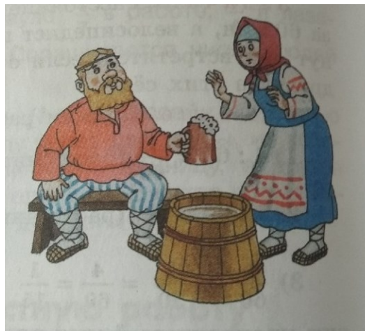
Рис. 1. Иллюстрация из учебника математики 5 класса [Никольский, Потапов, Решетников, 2018]

Учебники технологического цикла демонстрируют 41,1 % гендерно-окрашенных образов среди всех учебных материалов.